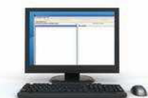
PC con software Hanna